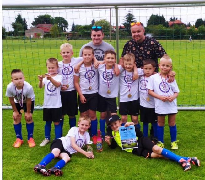
Autor: Martin Pálka

Na konci srpna znovu začínáme trénovat a velice rádi přivítáme nové tváře.